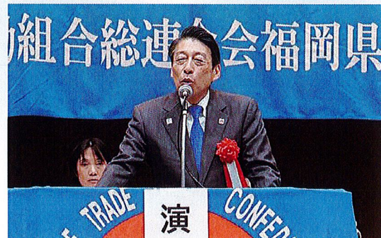
来賓あいさつ 服部誠太郎 福岡県知事