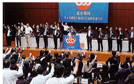
会場全体でのガンパロー三唱