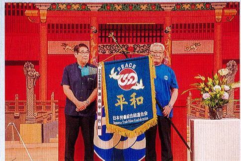
ピースフラッグ引継ぎのようす

その後、8月の平和行動in広島に向け、連合沖縄から連合広島へと「連合・平和行動旗(ピースフラッグ)」が引き継がれ、平和アピール(案)を採択し、集会は終了しました。