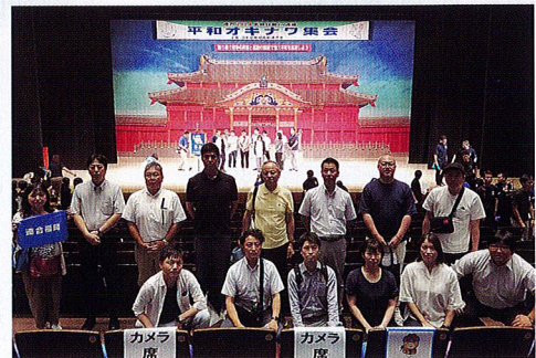
連合福岡からの参加者の皆さん