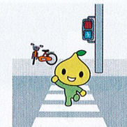
公式キャラクター ピットくん

7才の交通安全プロジェクト https://www.zenrosai.coop/anshin/7pj/