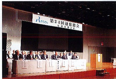
【第24回通常総会の様子】