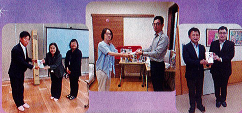
京築・田川地域労福協 (2023. 9. 27~10. 18) 贈呈先: 3 団体