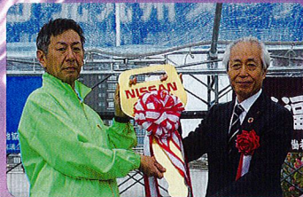
北九州地域労福協 (2023. 4. 29) 贈呈先: 北九州市社会福祉協議会