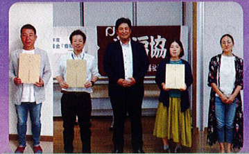
北筑後地域労福協 (2023. 9. 19) 贈呈先: 3 団体