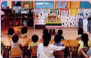
遠賀川地域労福協 (2023. 6. 22) 贈呈先: 株式会社PTR ぼたぼた園・ぼたぼた園 2