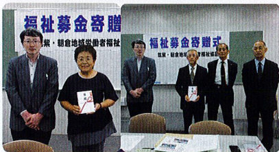
福祉募金寄贈 京築・朝倉地域労働者福祉協議会 福祉募金寄贈式 京築・朝倉地域労働者福祉協議会 贈呈先: 筑紫こども会議 社会福祉法人千代丸福祉障害者施設 千代の里