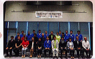
福岡地域労福協 (2023. 10. 1) 贈呈先: 10福祉事業所・団体等