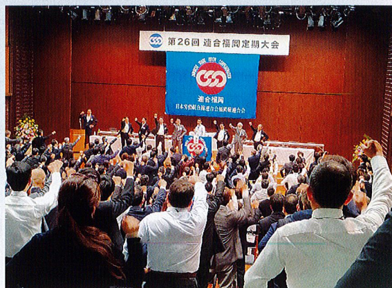
会場全体でのガンパロー三唱