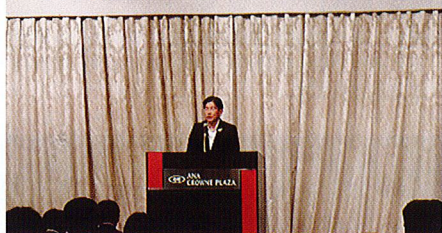
南部労福協友田会長挨拶