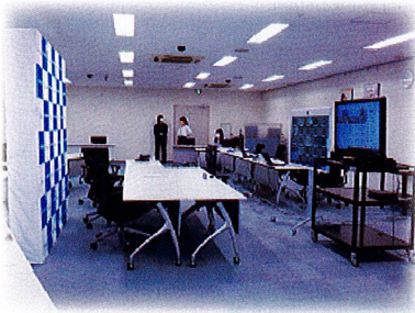
【テレビ会議システムによる通常総会の様子】

金庫を取り巻く環境は大きく変化していますが、これからも安定的な経営基盤を確立させながら、ろうきんらしいビジネスモデルを展開してまいります。引き続き、よろしくお願いいたします。