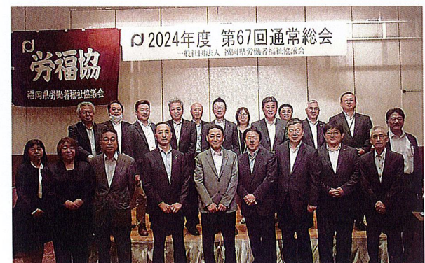
新旧役員のみなさん