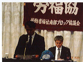
熊本県清田局長来賓挨拶