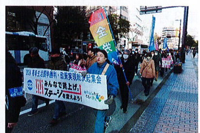
参加者全員でのデモ行進のようす