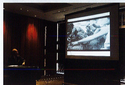
映画「ボタ山の絵日記」