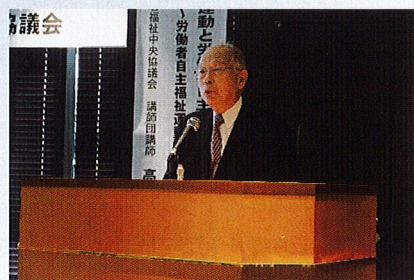
高橋中央労福協講師団講師