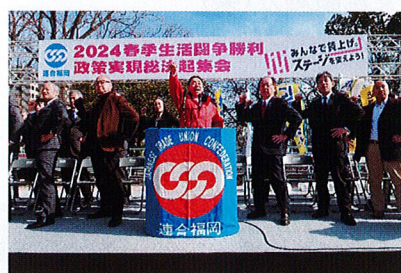
全体でのガンパロー三唱