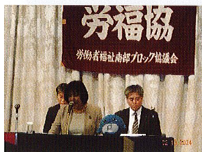
南部事務局長来賓挨拶