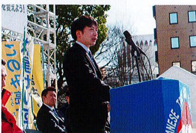
集会決議(案)の読み上げ