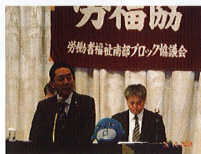
藤田代表幹事来賓挨拶