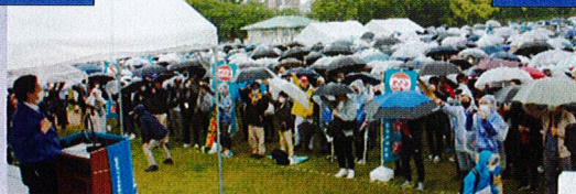
会場全体でのガンパロー三唱