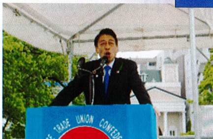
福岡県 服部誠太郎知事