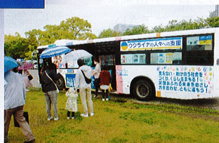
メーデー装飾バス