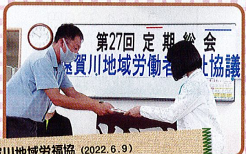
遠賀川地域労福協 (2022.6.9) 贈呈先: 社会福祉法人桂川町社会福祉協議会