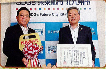
北九州地域労福協 (2022.5.12) 贈呈先: 北九州市社会福祉協議会