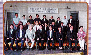
福岡地域労福協 (2022.10.2) 贈呈先: 10福祉事業所・団体等