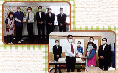
南筑後地域労福協 (2022.10.14) 贈呈先: 2事業所