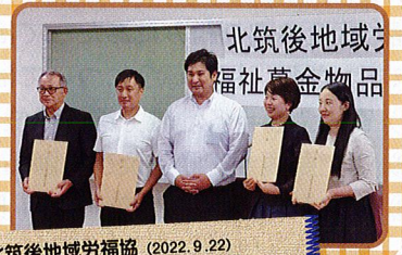
北筑後地域労福協 (2022.9.22) 贈呈先: 4団体