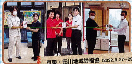
京築・田川地域労福協 (2022.9.27~29) 贈呈先: 3団体