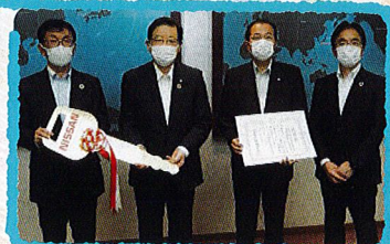
北九州地域労福協 (2021.5.19) 贈呈先: 北九州市社会福祉協議会