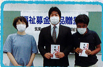
筑紫・朝倉地域労福協 (2021.10.5) 贈呈先: 筑紫野市「障害」児・者問題を考える会 自立援助ホーム リーブ