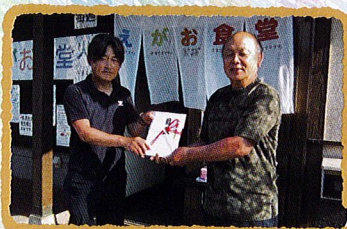
遠賀川地域労福協 (2021.6.22) 贈呈先: NPO法人つとい えがお食堂