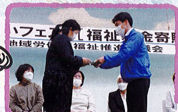
福岡地域労福協 (2021.10.23) 贈呈先: 12福祉事業所・団体等