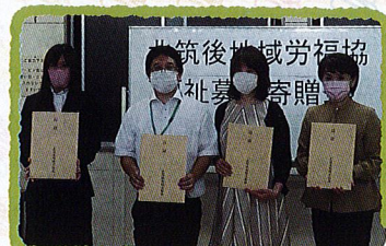
北筑後地域労福協 (2021.9.29) 贈呈先: 4団体