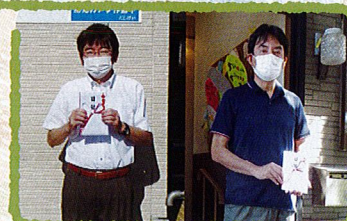
南筑後地域労福協 (2021.10.14) 贈呈先: 障がい者就労支援センター かけはし 障がい者支援センター ゆるり